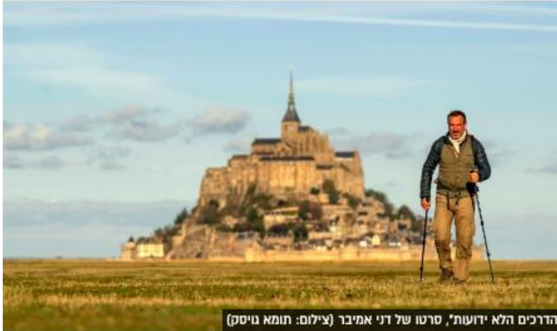
הדרכים הלא ידועות*, סרטו של דני אמיבר