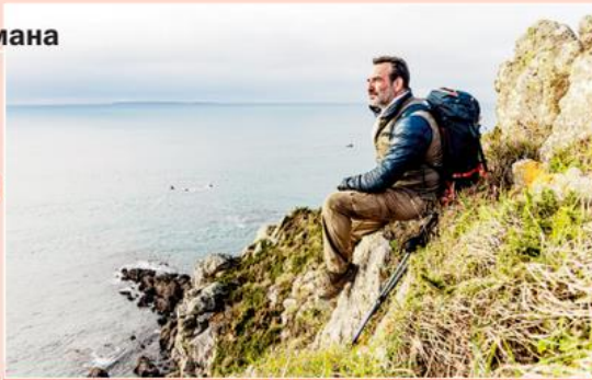
"По блуждающим тропам"

Главный герой фильма Пьер – известный писатель и исследователь. Однажды он, будучи в подлитии, стал карабкаться по наружной стене дома своего друга, упал с высоты и вследствие полученных травм впал в кому. Придя в сознание на больничной койке, Пьер вопреки советам врачей решает пройти пешком всю Францию. Герой не ищет легких путей, выбирая для своего необычного путешествия