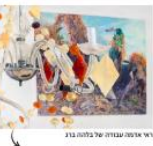
ראש הממשלה נתניהו על רקע ציור

הציורים המחזיקים הם ציורים שמחזיקים את הציור. הם ציורים שמחזיקים את הציור. הם ציורים שמחזיקים את הציור.