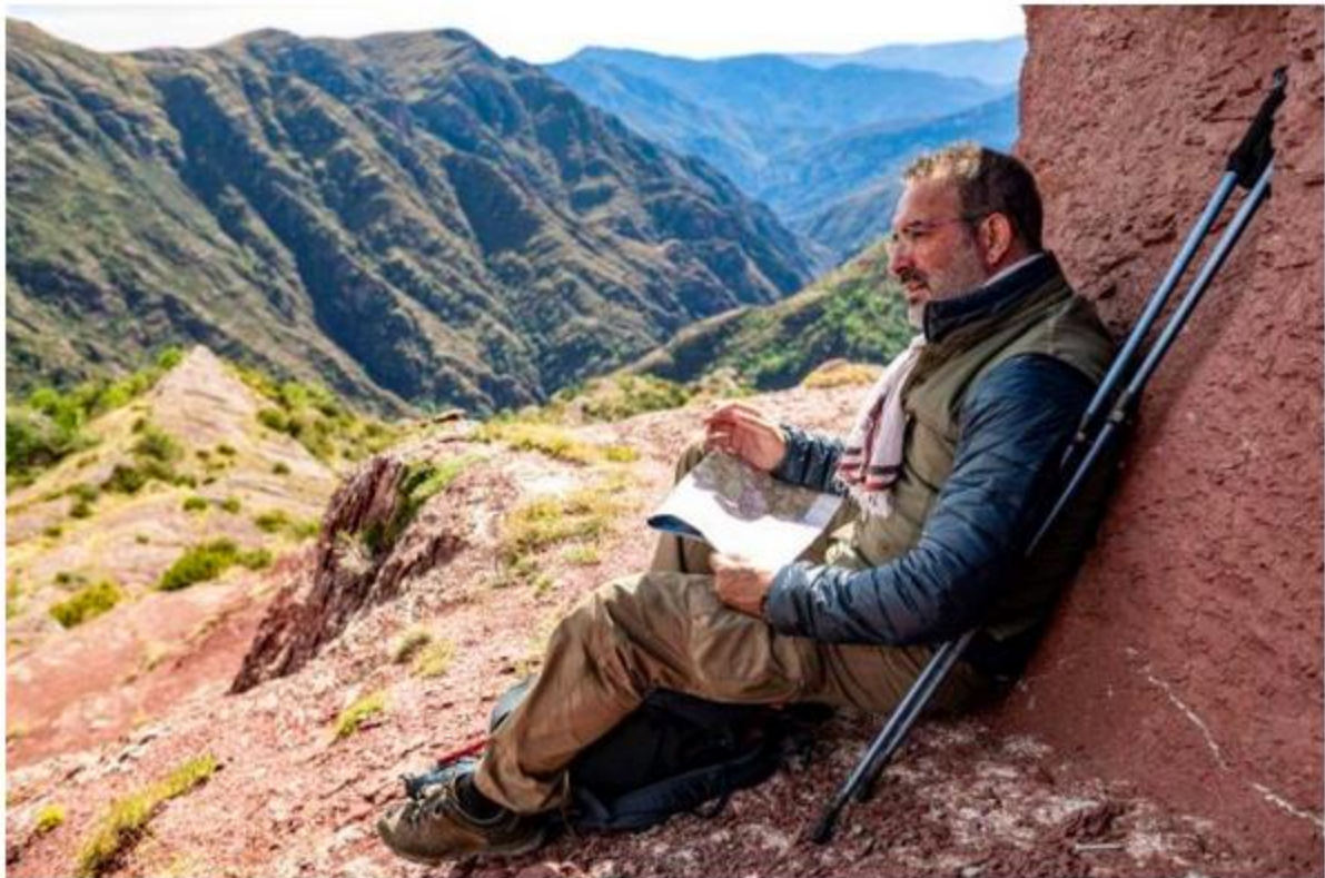
On the Wandering Paths

On the Wandering Paths (Sur les chemins noirs), starring Jean Dujardin, will open the French Film Festival on March 25, 2024. Now in its 21 st edition, the festival presents a