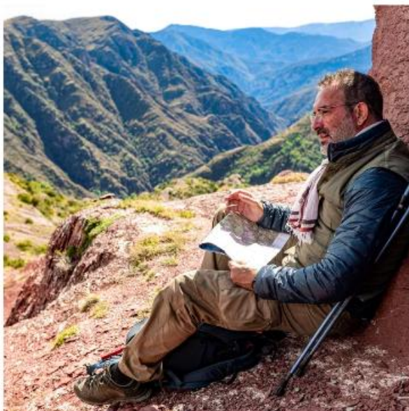
"הדרכים הלא ידועות"

הסרט "הדרכים הלא ידועות" יפתח מחר את פסטיבל הקולנוע הצרפתי שיתקיים בסינמסקופים ברחבי הארץ. יוקרנו בו סרטים חדשים כמו "אדוני השופט" לצד סרטים מהעבר כמו "הדוד מאמריקה"