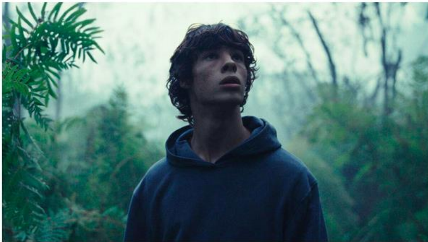
"ממלכת החיות". להיט בפרסי הסואר