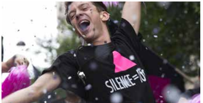
120 פעימות בדקה 120 BATTEMENTS PAR MINUTE

Prix Louis Delluc 2017 & Prix Jean Vigo 2017