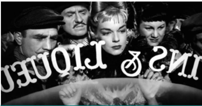
CASQUE D'OR קסדת הזהב

בימוי ז'אן בקר תסריט ז'אן בקר, ז'אק קומפנייה שחקנים סימון סניורה, סרז' רגיאני, קלוד דופין קומדיה דרמטית, 96 דקות באדיבות המכון הצרפתי. 1952 צרפתית, תרגום לעברית ואנגלית.