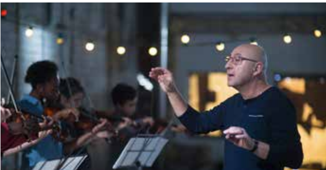
התזמורת LA MELODIE

« Tchekhovien, mélancolique, mais pas désespéré : superbe ! » Le Dauphiné Libéré