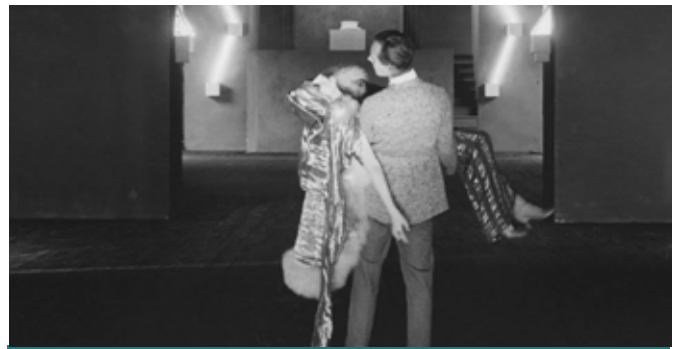
L'INHUMAINE הלא אנושי

« Franju, formidable alchimiste du réel et du fantastique, a façonné au scalpel un pur film d'épouvante, d'une poésie folle » Télérama