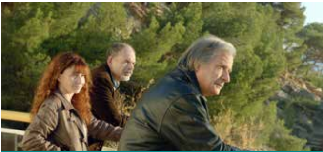
בית ליד הים LA VILLA

בימוי רובר גידיגיאן תסריט רובר גידיגיאן, סרז' ולנטי שחקנים אריאן אסקאריד, ז'אן פייר דארוסן, ז'ראר מיילאן דרמה, 107 דקות. צרפתית, תרגום לעברית ואנגלית.