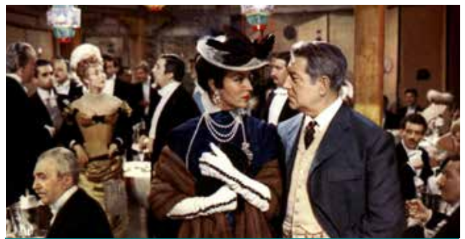
FRENCH CANCAN קנקן צרפתי

« Entre expressionnisme et cubisme, il multiplie les lieux étranges et les situations déroutantes : une vaste demeure, très géométrique, un jardin d'hiver hérissé de plantes exotiques à la Gauguin » Télérama