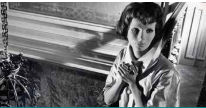
LES YEUX SANS VISAGE עיניים ללא פנים

« Avec le lyrisme sec qui lui est propre, Becker décrit les rouages d'une tragédie implacable : la violence d'une passion qui lie deux amants jusque dans la mort » Télérama