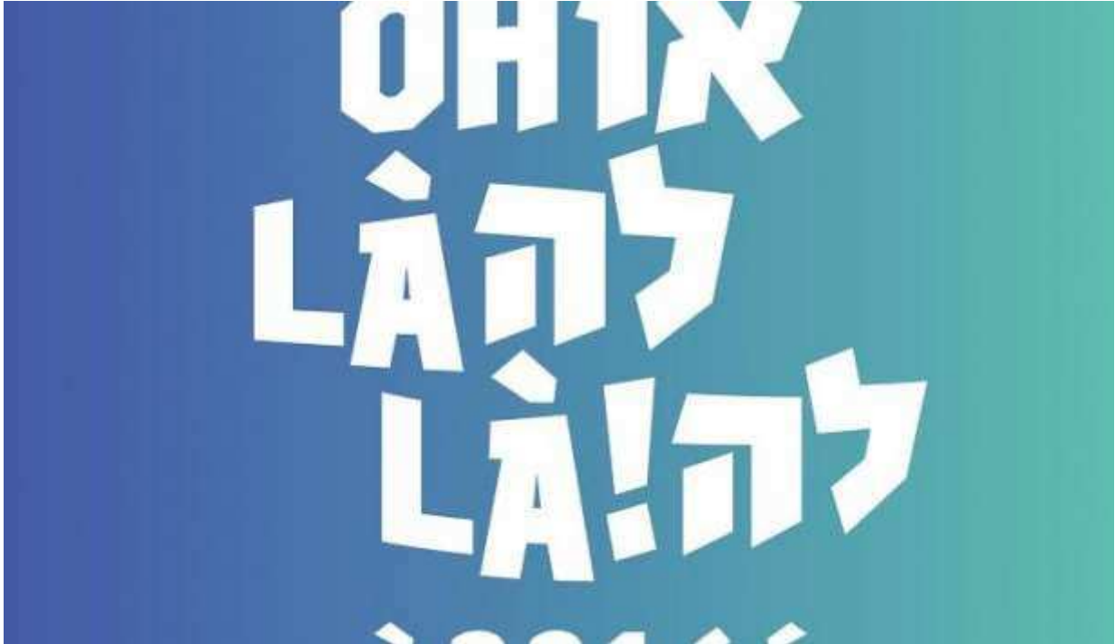
Affiche du Festival de films français de comédie en Israël "Oh la la"