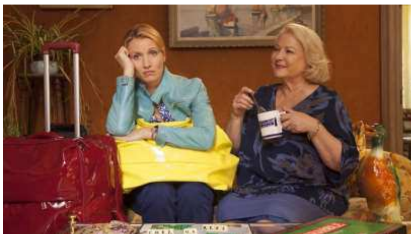
"לחזור לגור עם אמא" (יח"צ)

מאחורי הקלעים: בימוי - אריק לאבן, תסריט - אריק לאבן והקטור קביו רייס