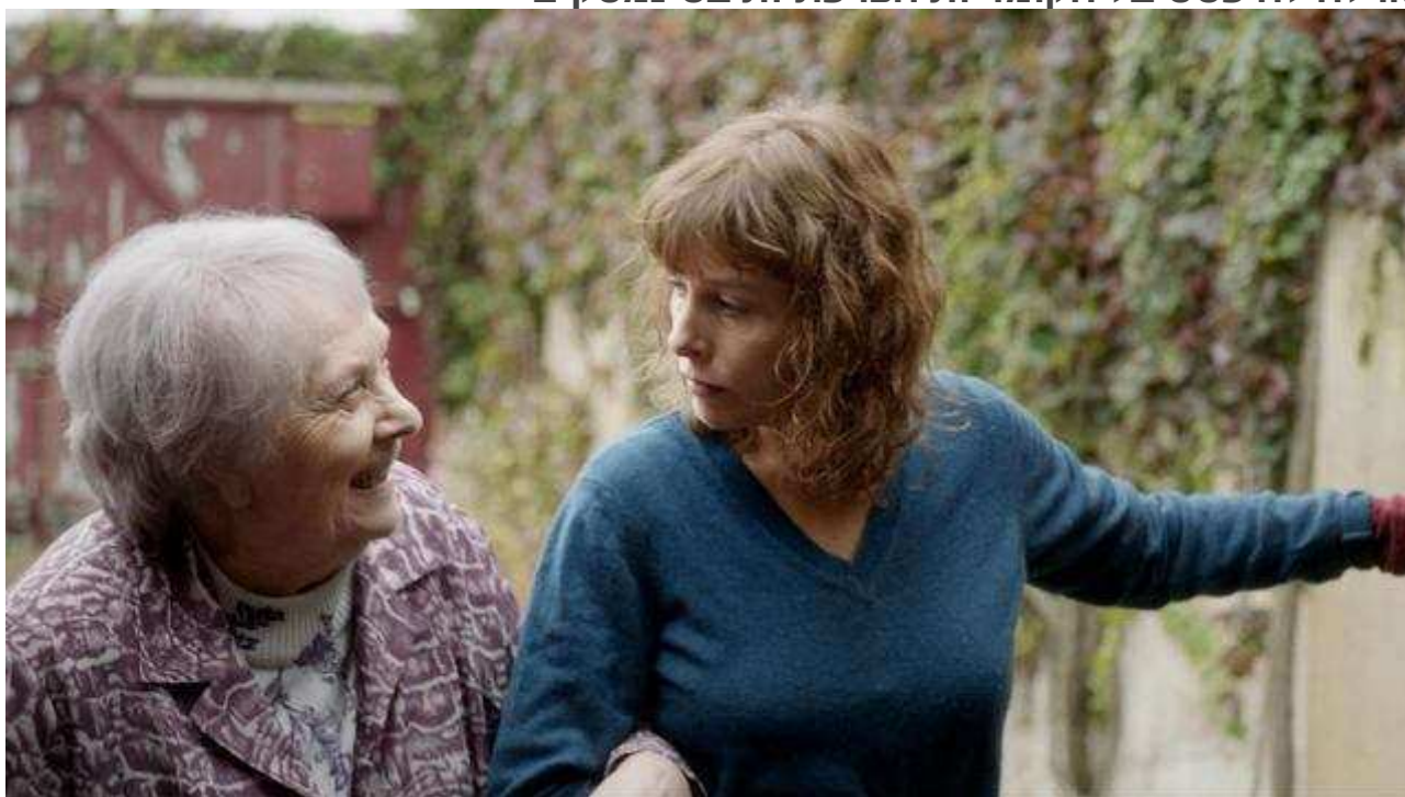
לולו אישה ערומה