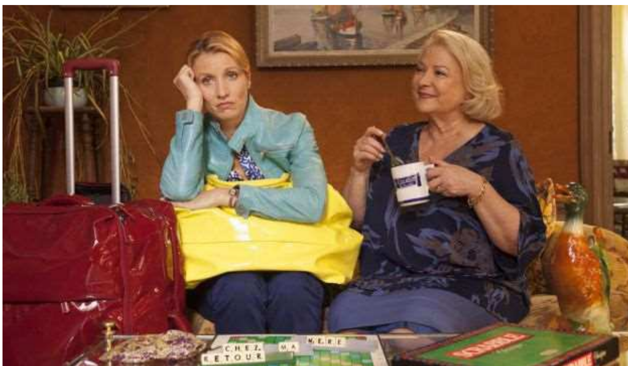
"להחזור לגור עם אמא"

קולנוע. "או לה לה", פסטיבל הקומדיות הצרפתיות, ייפתח ברחבי הארץ. סרט הפתיחה הוא "להחזור לגור עם אמא" שביים אריק לאבן. בפסטיבל שיימשך עד 29 בחודש יוקרנו "להתאהב מעל הראש", "ההרפתקה הגדולים" וסרטים אחרים.