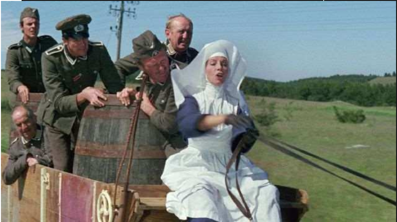
או לה לה: פסטיבל הקולנוע הצרפתי