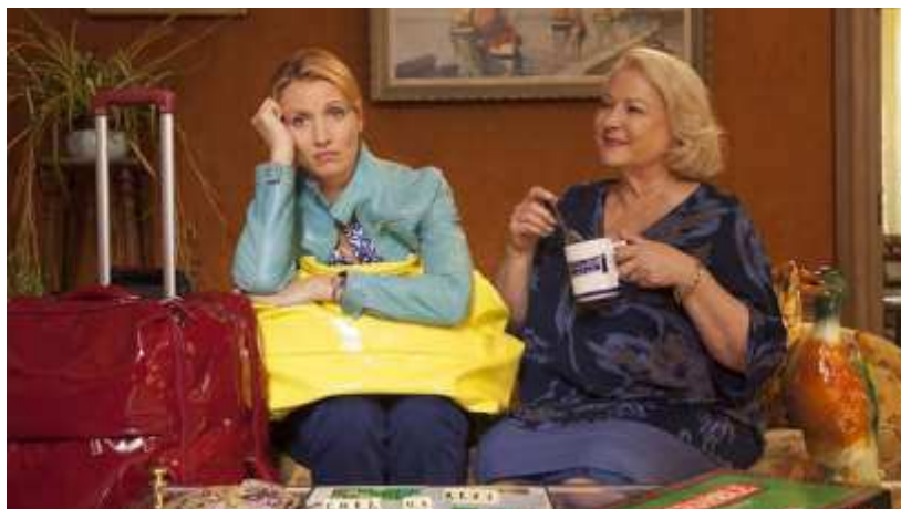
"לחזור לגור עם אמא" (יח"צ)

את הפסטיבל תפתח אחת הקומדיות המצליחות ביותר השנה בצרפת "לחזור לגור עם אמא" (2016) שביים אריק לאבן. ג'וזיאן בלסקו, אלכסנדרה לאמי ומתילד סנייה בקומדיה מצחיקה ומרגשת על אישה בשנות הארבעים לחייה הנאלצת לחזור לגור עם אמה, קומדיה על אזור המלחמה המסוכן ביותר בעולם, המשפחה.