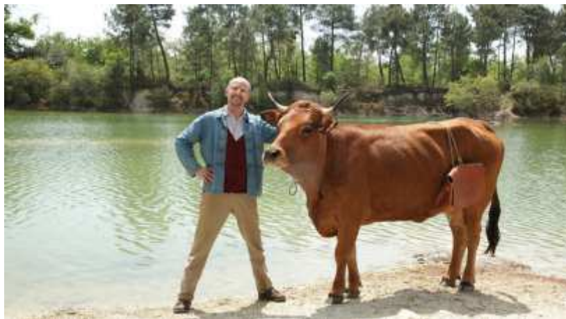
"הפרה ז'קלין"

"ברוכים הבאים למרלי גומון" (2016) מבוסס על סיפור אמיתי, רופא צעיר שחור עור מקונגו/זאיר שסיים את לימודיו בצרפת ב-1975 מקבל הצעה להיות רופא כפרי בכפר ליד פריז, אבל כשהוא מגיע עם משפחתו לכפר תושביו בהלם, והרופא נאבק כדי להתקבל על ידי בני המקום.