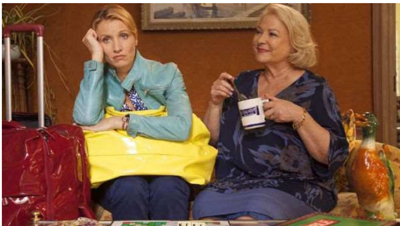
או לה לה: פסטיבל הקולנוע הצרפתי

בואו להינות, לצחוק ולהתרגש מקומדיות צרפתיות בשלל סגנונות ולצאת עם חיוך על הפנים. עם מיטב הקומיקאים של הקולנוע הצרפתי, לואי דה פינס, בורביל, דני בון, ז'ראר דפרדייה, קרין ויאר, ז'אן דוז'רדן, בנואה פולבורד, כריסטיאן קלבייה, ג'מאל דבוז ועוד