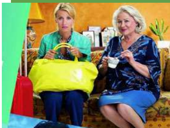
פסטיבל קומדיות (יח"צ)

פסטיבל הקומדיות הצרפתיות או לה לה! ייפתח עם שלל אורחים והקרנות מיוחדות