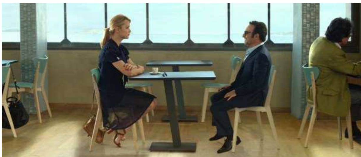
Кадр из фильма «Любовь не по размеру» ( Un homme à la hauteur )

В рамках фестивальных показов можно будет увидеть также классическую «Большую прогулку» с королем французской комедии Луи де Фюнесом и две новых комедии: «Лулу» и «Скупой» с участием Дэни Буна, одного из самых любимых современных французских комиков. Кроме того, фестиваль почитит память ушедшей от нас Сольвейг Анспах, режиссера «Лулу — обнаженная женщина» с блистательной Карин Вьяр («Семейство Белье») в главной роли. Гостем фестиваля будет и Самир Гесми, также игравший в нескольких фильмах Анспах.