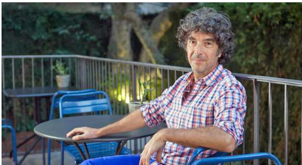
הבמאי אריק לבאן. "חששתי שאמא שלי תרגיש לא בנוח כשתראה את הסרט"

לבאן נולד בצרפת בשנת 1966, וזה סרטו השישי שיוצא לבתי הקולנוע. ואולם, מה שמייחד את "לחזור לגור עם אמא" הוא שהגיבורות שלו הן נשים. "עד כה הדמויות הראשיות שלי היו גברים ונורא רציתי לרענן ולכתוב לנשים. הקושי הוא שקל מאוד לצחוק על גברים, אבל עם נשים זה קצת יותר מסובך, יותר רגיש. לדוגמה, קל לצחוק על דמות שמנה, אבל אם הדמות הזאת היא אמא, אז זה בכלל לא מצחיק. ובכל זאת, הפעם החלטתי לנסות לעמוד באתגר."