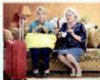
"Возвращение к матери"

Фестивальные показы пройдут в Синематексах Тель-Авива, Иерусалима, Хайфы, Сдерота, Холона, Герцлия, Рош Пины, в Доме культуры Савьона, в зале "Зоар" Кирият-Тивона и вшодском "Глобус Макс". Показы продлятся до конца декабря.