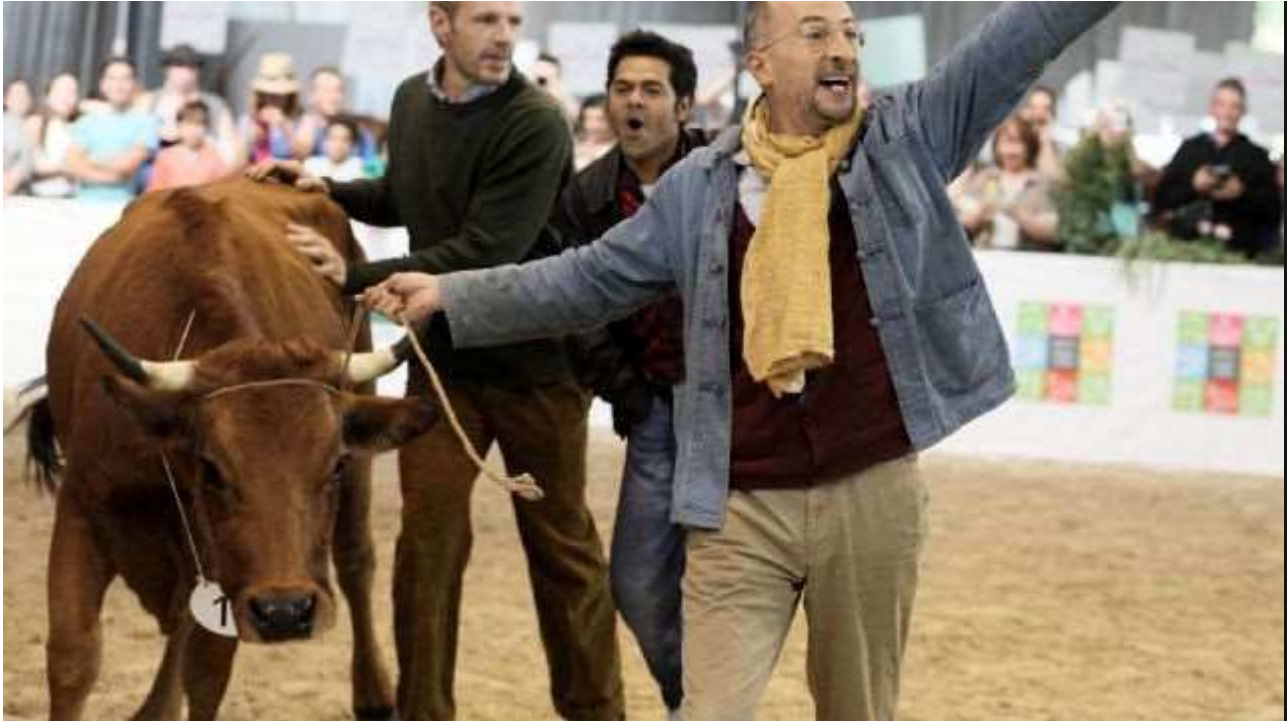
או לה לה: פסטיבל הקולנוע הצרפתי