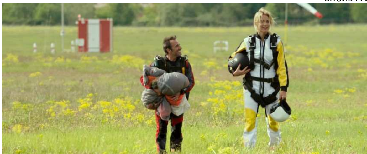
להתאהב מעל לראש