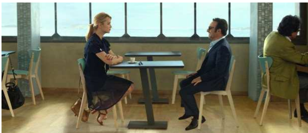
Кадр из фильма «Любовь не по размеру» (Un homme à la hauteur)