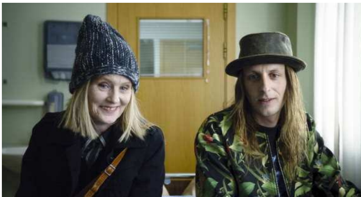
L'Effet Aquatique

L'Effet Aquatique is a quietly magnificent film, that takes the genre of romantic comedy and reinvents it, imbuing it with the power to stir the emotions. Romantic comedy has, for the most part, evolved into a highly predictable genre, with a revolving set of available tropes. For some fans, this predictability is part of the appeal – movies that can be pleasantly half-watched, and soon forgotten. Anspach's films break the mold, with creativity, intelligence, and a flair for the bizarre.