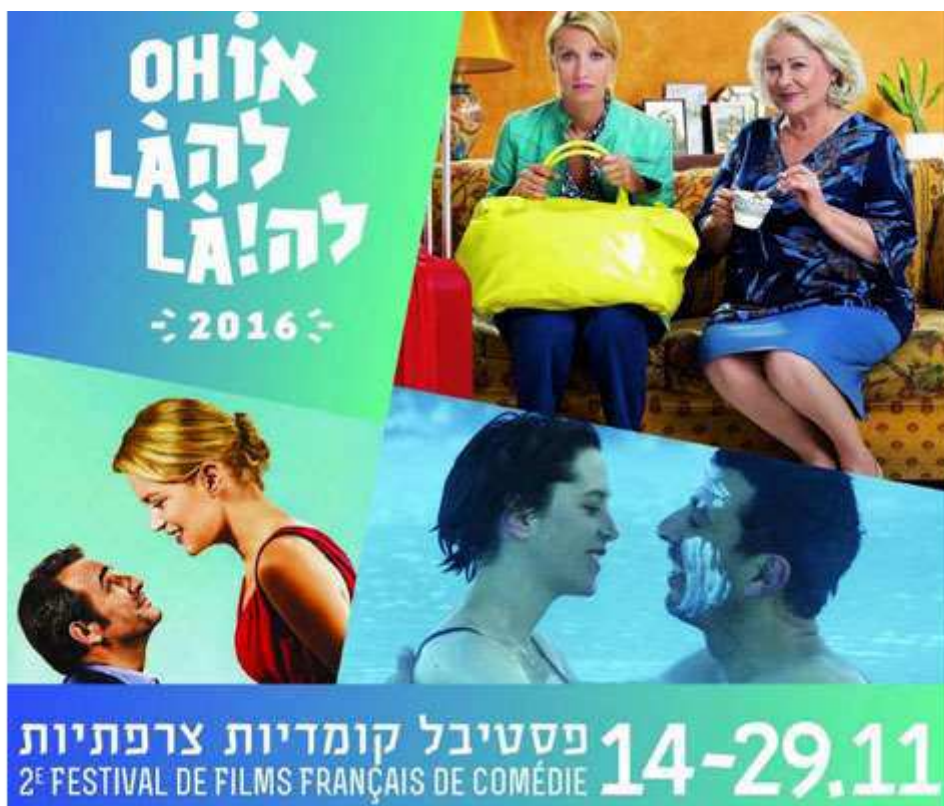
פסטיבל קומדיות צרפתיות (יח"צ)

הפסטיבל יתקיים בסינמטקים של תל אביב, ירושלים, חיפה, שדרות, חולון, הרצליה, ראש פינה, בית התרבות בסביון, אולם זהר בקרית טבעון, גלובוס מקס אשדוד. הקרנות מיוחדות של מבחר מסרטי הפסטיבל יתקיימו גם בכל רשת יס פלאנט, איילון, ירושלים, חיפה, ראשון לציון ובאר שבע וכן בסינמה סיטי גלילות וקולנוע פארק ברעננה.