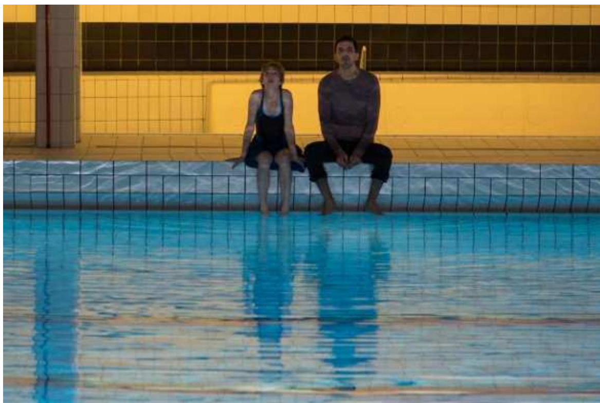
L'Effet Aquatique

You can open minds and hearts with either tears or laughter – given the choice, I prefer laughter. The OH LÀ LÀ festival of French comedies presents a wonderful variety of comedies, 17 features in all, as well as screenings of short films. The festival, now in its second edition, will take place from November 14 – 29, 2016. Screenings will take place at the cinémathèques in Tel Aviv, Jerusalem, Haifa, Sderot, Holon, Herzliya, Rosh Pina, Savyon Culture Center, Zohar Hall in Tivon, and Globus Max Ashdod. There will also be special screenings at YesPlanet in Ramat Gan, Jerusalem, Haifa, Rishon LeZion and Beer Sheva, as well as Cinema City Gilot and Park Cinema Raanana. All feature films will be shown with subtitles in English and Hebrew.