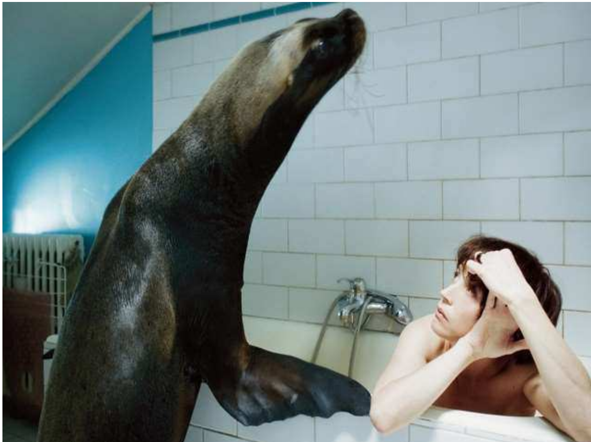
"מלכת מונטריי" – מחווה לסולבג אנספה

הסרט השני הוא " מלכת מונטריי " – סרט בעל מוטיבים ביוגרפיים גם הוא בכיכובו של גסמי. אגת חוזרת למונטריי ומנסה להתמודד עם מותו של בעלה, אבל אולי היא היתה מצליחה לעשות את זה טוב יותר, לו לא היתה סוחבת לכל מקום את כד האפר שלו.