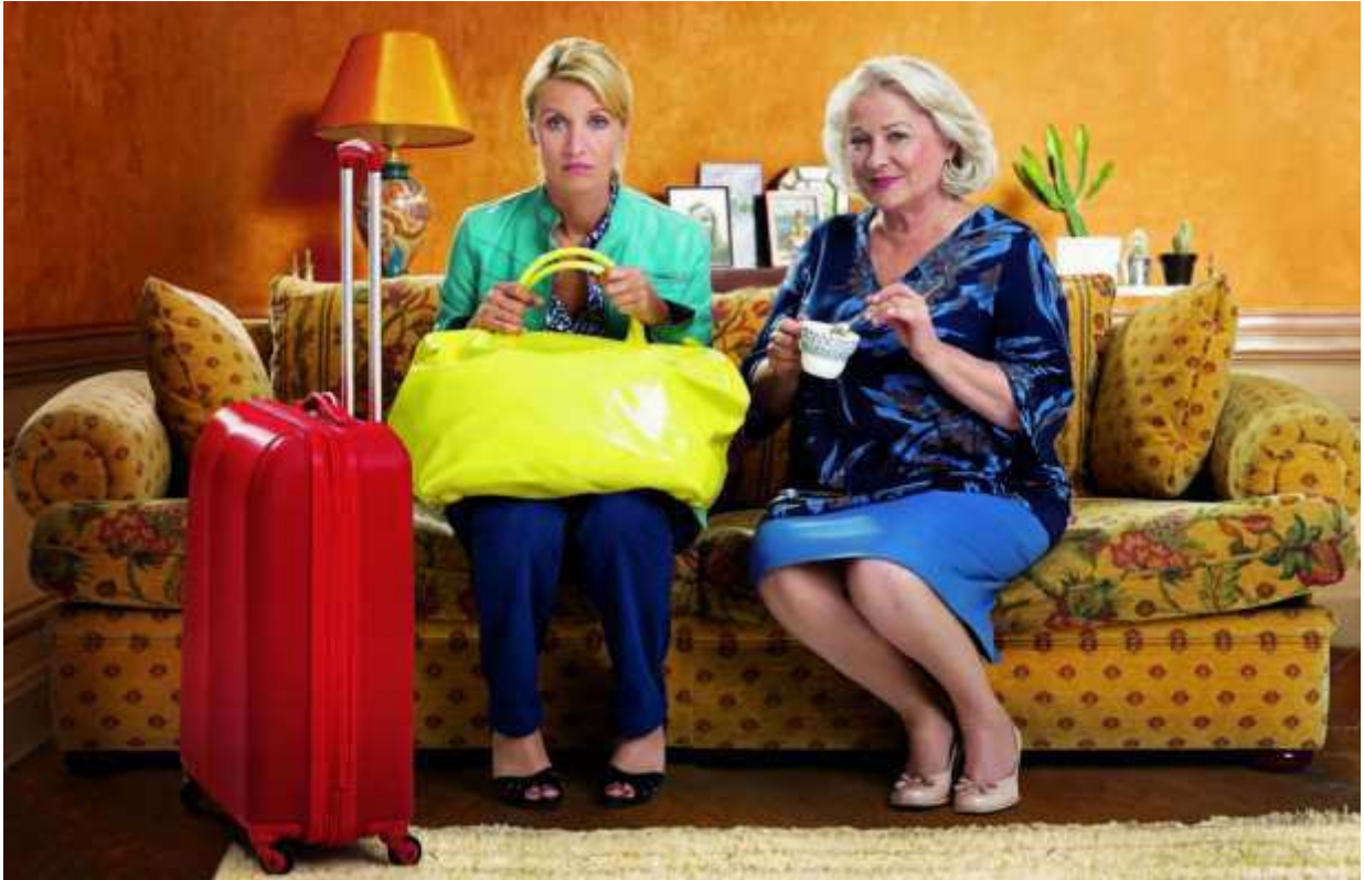
-De retour chez ma mère- à Tel-Aviv