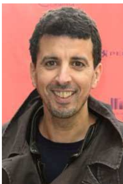
Le comédien français Samir Guesmi.

C'est l'histoire de Samir. Attention je ne parle pas de moi à la troisième personne (rires) ! il est grutier à Montreuil et va tomber raide amoureux d'une fille qui envoie balader un sale type dans un troquet.