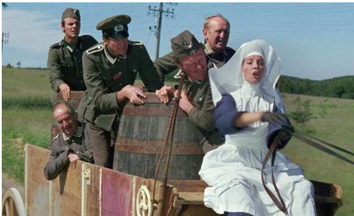
"האנגלים באים, האנגלים באים" – מן הקלאסיקות

הבסטיליה, יצא עותק דיגיטלי משוחזר של הסרט ואותו נציג בפסטיבל. בשנות השישים הסרט הופץ בישראל תחת השם " האנגלים באים, האנגלים באים ".